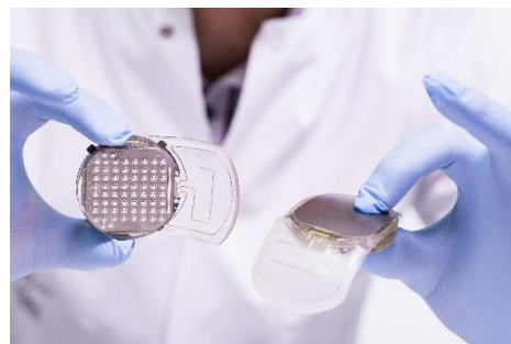
Implant WIMAGINE®

Des cartes électroniques regroupent les briques d'acquisition et de numérisation des électrocorticogrammes conçues grâce aux experts en microélectronique du CEA-Leti, ainsi que des briques de télé-alimentation et de transmission des données sans fil par liaison radio sécurisée vers un terminal externe. Le packaging de l'implant a été conçu pour garantir sa biocompatibilité et sa sécurité à long terme. Les implants ont été rigoureusement testés pour vérifier leur conformité par rapport aux exigences essentielles issues des directives européennes concernant les dispositifs médicaux implantables actifs.