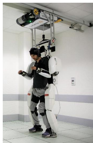
Pilotage de l'exosquelette 4 membres par le patient dans le cadre du projet BCI mené à Clinattec

Pour la première fois, un patient tétraplégique a pu se déplacer et contrôler ses deux membres supérieurs grâce à une neuroprothèse, qui recueille, transmet et décode en temps réel les signaux cérébraux pour contrôler un exosquelette. Publiés le 4 octobre 2019 dans la revue The Lancet Neurology, les résultats de l'étude clinique du projet Brain Computer Interface (BCI), réalisée à Clinattec (CEA, CHU Grenoble Alpes), valident la preuve de concept du pilotage d'un exosquelette 4 membres spécifique. Ce pilotage est permis par l'implantation long-terme d'un dispositif médical semi-invasif de mesure de l'activité cérébrale, développé au CEA. Cette technologie est destinée, à terme, à donner une plus grande mobilité aux personnes en situation de handicap moteur.